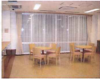
各ユニット リビング