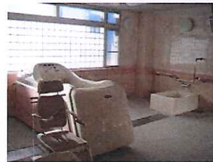
1階・2階・4階チェアインバス