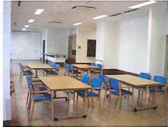
デイサービス活動フロア