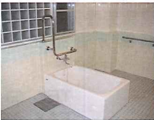
2階・3階・4階・5階個人浴槽