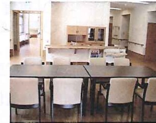
各階 交流スペース