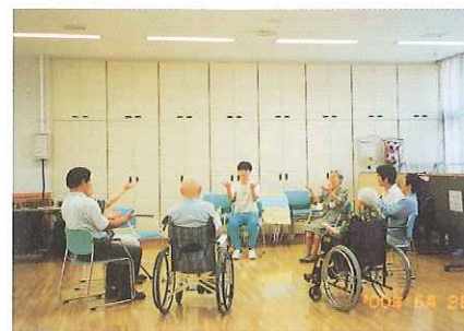
リクレーション活動