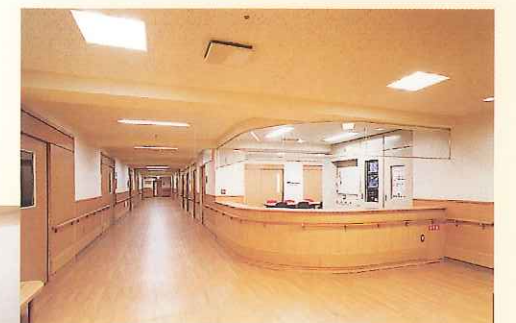
2F ワークステーション