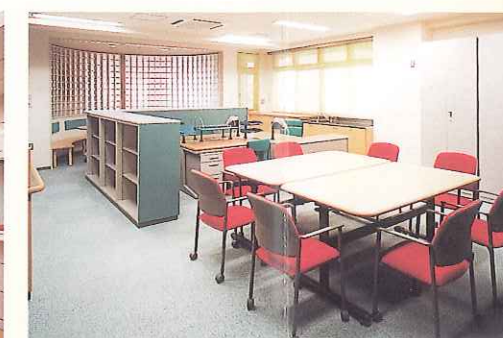
1F 介護相談センター